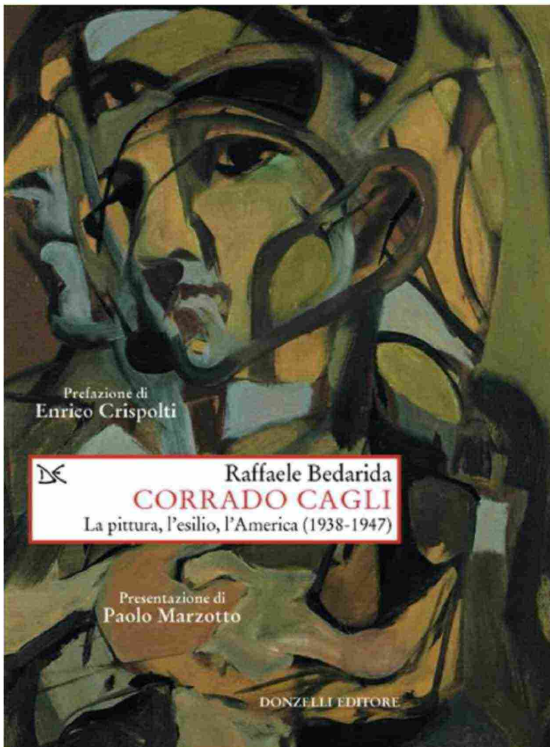
Raffaele Bedarida - Corrado Cagli (Donzelli, Roma 2018)