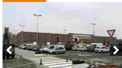
Dopo la spesa derubata con destrezza al parcheggio dell'Esselunga